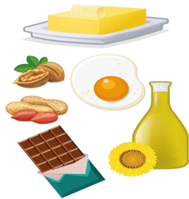
продукты, содержащие жиры