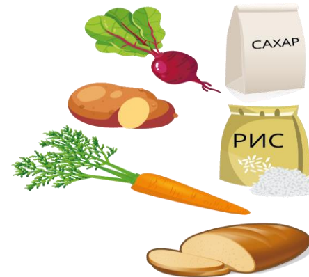
продукты, содержащие углеводы